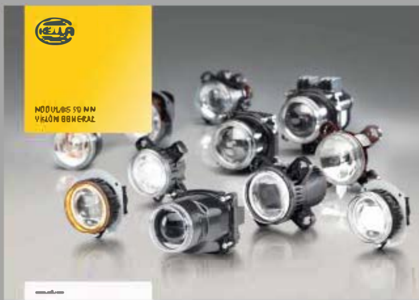
CATÁLOGO MÓDULOS 90MM