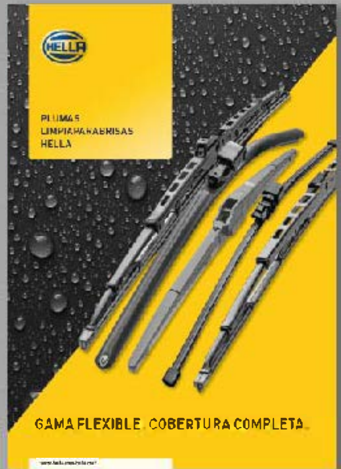
CATÁLOGO DE PLUMAS