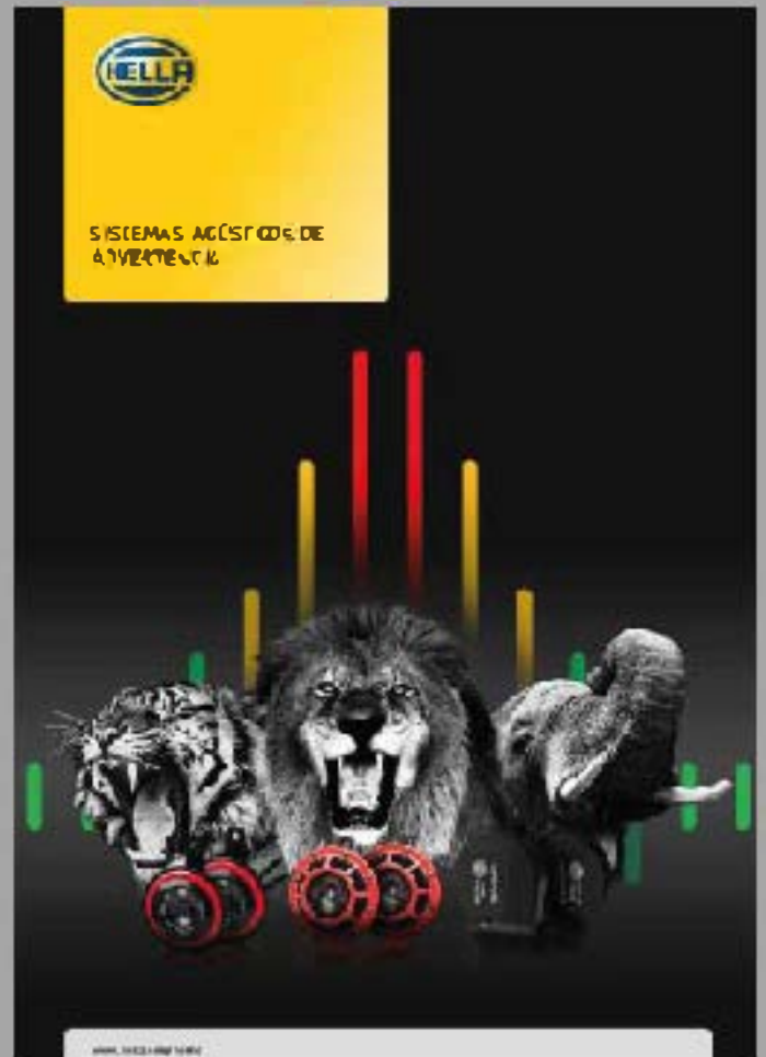
CATÁLOGO SISTEMAS ACÚSTICOS DE ADVERTENCIA